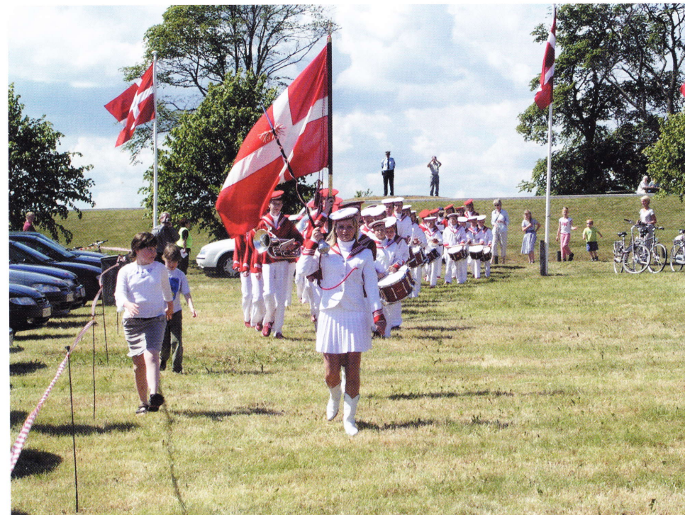
Vi er glade for vor grundlov, og vi fejrer den hvert år overalt i landet.

Stk. 3: „Unionen arbejder for en bæredygtig udvikling i Europa baseret på en afbalanceret økonomisk vækst og prisstabilitet, en social markedsøkonomi med høj konkurrenceevne, hvor der tilstræbes fuld beskæftigelse og sociale frem-