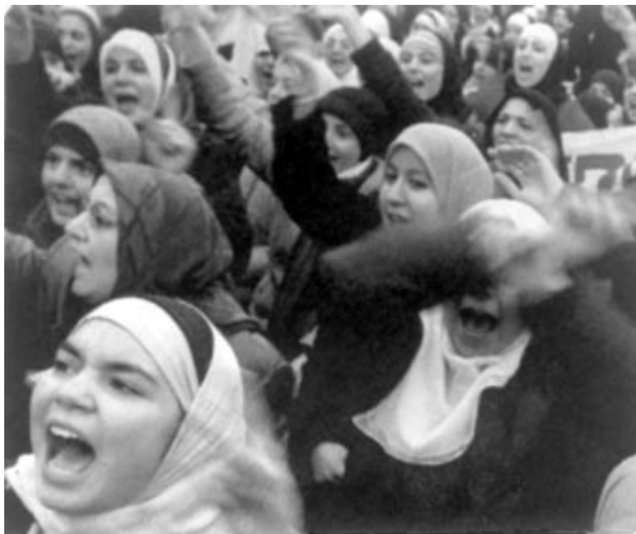
Demonstranternes ansigter taler her desværre for sig selv.

Nov. 99 dræber manden sin kone og deres ene datter i Tingbjerg ved København. Han torpederer dem med sin bil, da de er på vej til børnehaven, og skærer halsen over på dem, medens andre magtesløse må se til. En