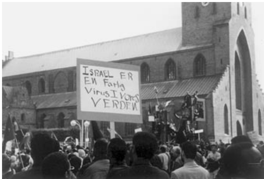
6. okt. 2000. Flere end tusind Hamas- og PLO-støtter demonstrerer foran Odense Domkirke med grønne Jihad-bannere, palæstinensiske flag og antisemitiske paroler.

Som Allah (saws) siger i den hellige Koran: „Når I møder dem, som er utro, så halshug dem, til I har lavet et blodblad iblandt dem. Og bind