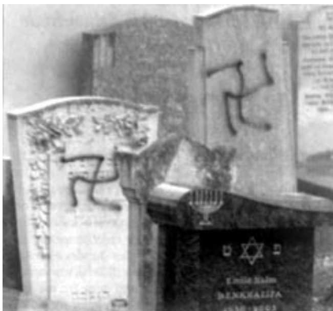
Muslimere har her forsynet jødiske gravsten med hagekors.

dem fast. Og lad dem siden betale løsepenge, indtil de nedlæger deres våben. Derefter skal du fortsætte med at føre krig mod ikke-muslimerne, indtil de antager islam. Om Allah ville det, så kunne han have udslettet dem, men det er for at prøve jer. Men de muslimer, som dør i hellig krig, de vil aldrig gå fortabt.“(sura 47.4).