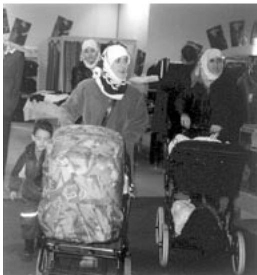
Gjellerupcenteret i Århus vrirler med barnevogne. Den islamiske bevægelse Hamas skrev i sine vedtægter, at muslimske kvinder skal føre jihad gennem børnefødsel. Måske er denne form for jihad mere alvorlig end

Dette kan reelt ske uden våben, hvis den oprindelige befolkning blot giver efter, lader sig integrere og retter sig efter det islamiske samfunds krav, som slagterikoncernen Danpo, der i årevis har halalslagtet alt dansk fjerkræ, eller Københavns kommune, hvis skolemadpakkeordning følger islamiske halalregler. Af de mange dokumentartekster fremgår dog, at