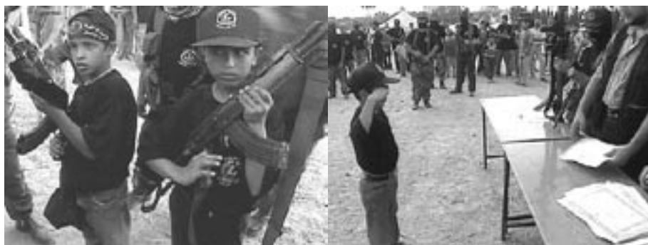
Børn oplæres til jihad fra barnsben af. Først træning, så eksamensbevis.

fra den myrdede og angreb forfatteren Hirsi Ali med ordene: „Sådan en kvinde burde ikke have lov til at gå frit omkring på gaden. Én ville komme at skælde hende ud, en anden ville sikkert slå hende.“