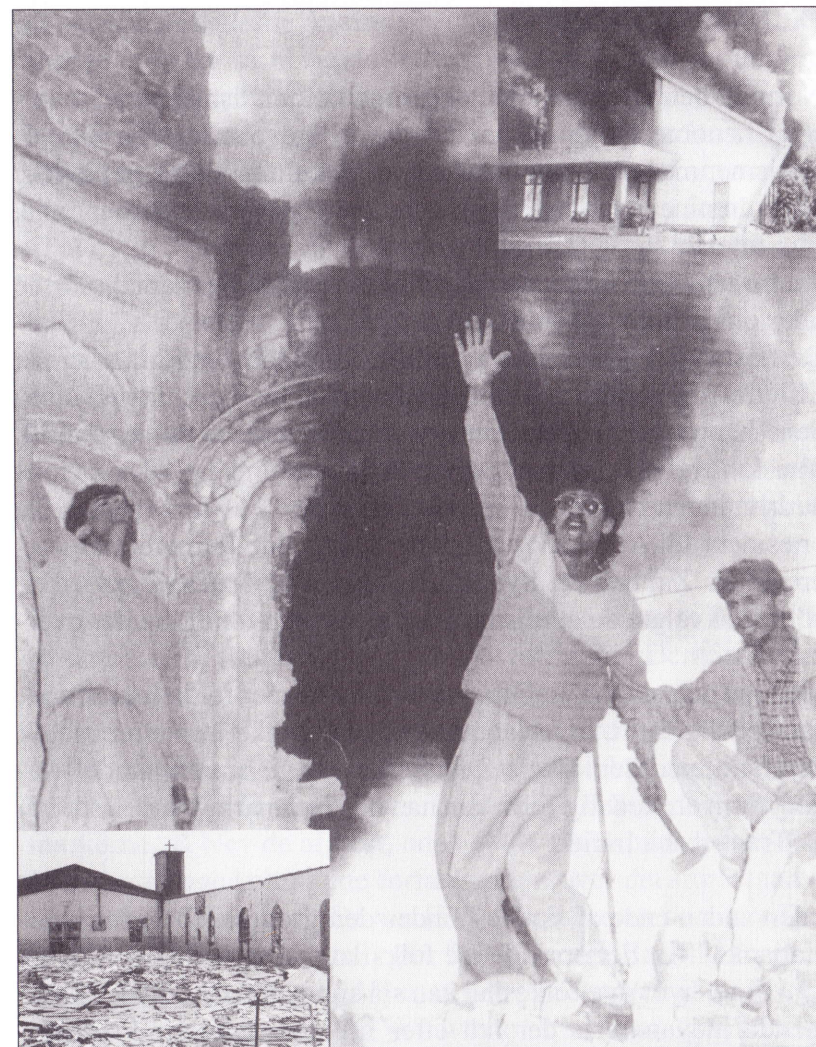
Kristne flygter fra muslimsk land: Billeder af brændende helligdomme fra de seneste år. Hindutempel nedbrændes og nedbrydes. Øverst en af de mange brændende kirker i Indonesien. Nederst nedbrændt baptistkirke i Nordnigeria.

Guds ord de nok skal lade stå og dertil utak have, thi Herren selv vil med os gå alt med sin Ånd og gave; Og tager de vort liv, gods, ære, barn og viv, lad fare i Guds navn dem (muslimerne) bringer det ej gavn, Guds rige vi beholder (Jævnfør salme 46)