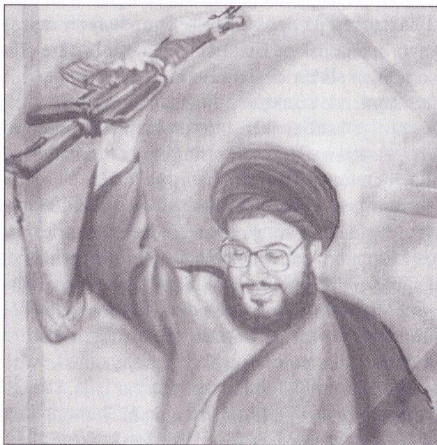
Ledende åndelige skikkelser i islam blev tidligere ofte fremstillet med sværd i hånd som symbol på "Islams sværd". I dag er sværdet som oftest erstattet med en maskinpistol. Her ses den åndelige leder af Hizballah i Libanon sheik Hassan Nasrallah på en plakat

dighed mellem kønnene, så er der ingen mulighed for at kunne leve sammen. Det er forkert at sætte et lands overlevelse og den indre fred over styr på grund af, at man mangler indsigt i, at visse kulturer per definition udelukker hinanden. Hvorfor styre mod et lands opløsning og en befolknings selvdestruktion, blot fordi man var bange for at tage en afgørende beslutning? Danmark er i yderste konsekvens moralsk ikke bundet af andre konventioner end af vort lands overlevelse. Ingen ydre konventioner kan sættes over et landets indre fred. Enhver politiker må være bundet af netop dette ene.