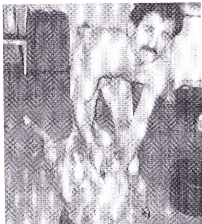
Hallalslagtning i Købbyen i København.

islamisk lovgivning uden at tænke over konsekvenserne på længere sigt, herunder love om hallalføde, hijab (islamisk klædning) og øvrige hallal-love. Disse love er stærkt diskriminerende for ikke-muslimer.