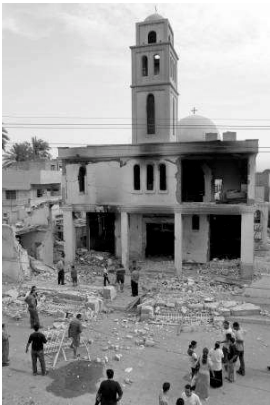
Kirke angrebet i Bagdad