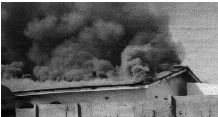
Den brændende kirke i Kano i Nigeria.