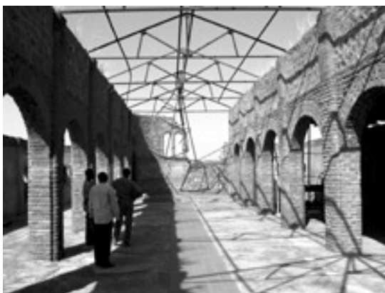
Soldater stjal taget på Katcha kirken i 1999