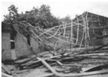
Sådan ser en kirke i Nigeria ud, når den har været udsat for islamisk behandling.