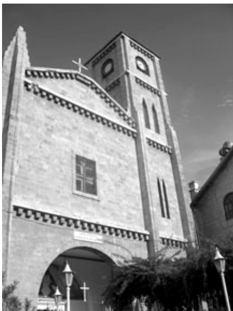
Kirken i Mersin, Tyrkiet