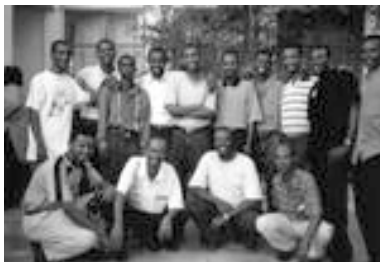
Nogle af dem, der blev fængslet for kristentro

Mindst to saudis-aviser, Al Jazirah og Al Yaum, skrev om angrebet dagen efter, hvor de forklarede, at praktiseringen af en hvilken som helst religion bortset fra islam var ulovligt.