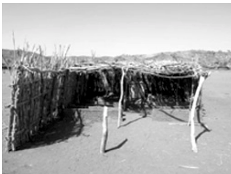
Shatt Damam kirken, før næste brand.

03/05/2006 (Compass Direct). I en by i Nubabjergene i Sudan er den eneste kirke en halvbygget kirke. I lyset af trusler fra en lokal muslimsk militsleder har kristne i Centralsudan besluttet at efterlade deres halvbyggede kirke, efter at den gik op i flammer dagen efter jul. Menigheden i den episkopale kirke i Shatt Damam håber, at delvis genopbygning vil hjælpe til, at den ikke bliver brændt ned for fjerde gang.