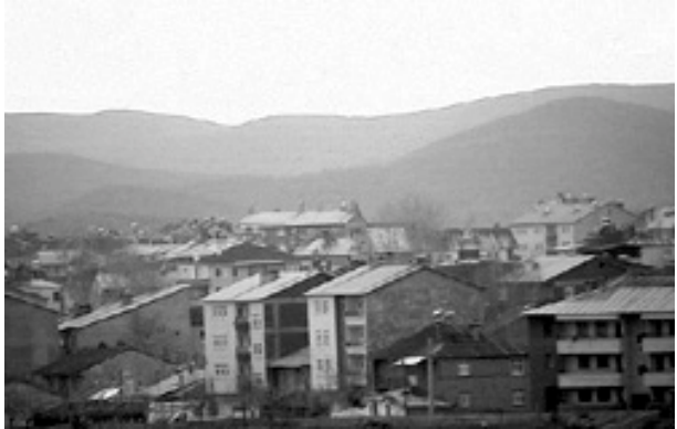
Bingol med 68.876 indbyggere

Gunyel bebrejdede guvernøren og sikkerhedsdirektorat for at forholde sig tavse om problemet. Bingol-guvernøren Vehbi Avuc nægtede gentagne gange at tale med Compass, og hans sekretær sagde, at han ingen anelse havde om situationen.